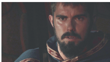
NÆRBILLEDE Et ansigt/en genstand tæt på