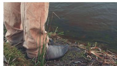
ULTRANÆR En detalje helt tæt på