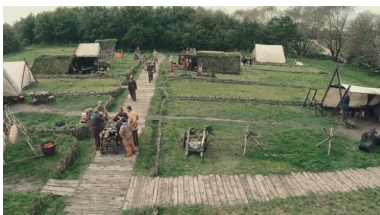
SUPERTOTAL Et område, et miljø