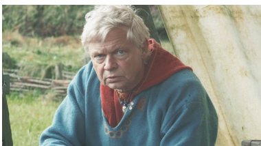
HALVNÆR Personer fra brystet og op