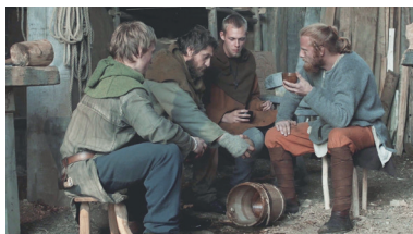
TOTAL Personer i fuld figur