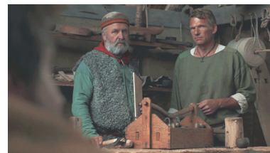
HALVTOTAL Personer fra livet og op